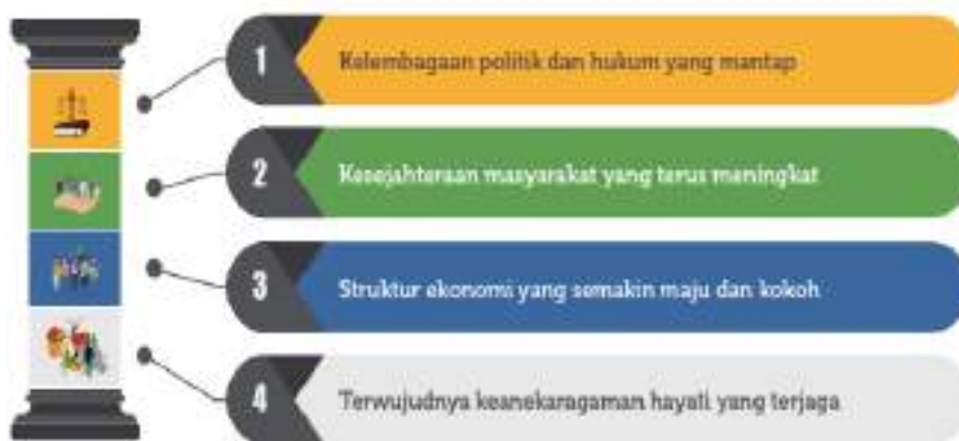
Gambar 3.1 Empat Pilar RPJMN IV tahun 2020-2024

Sumber : Narasi RPJMN 2020-2024 Bappenas, 2019